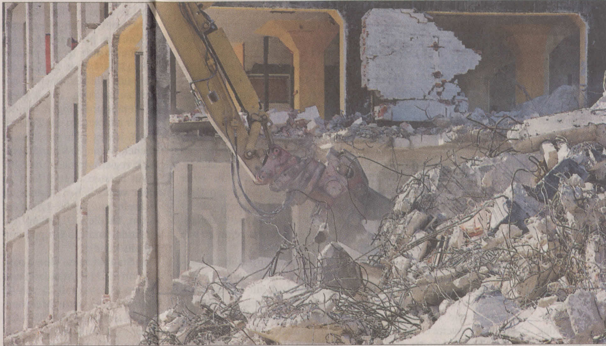
Durch das Stahlbetongerippe dieses Speichergebäudes frisst sich die gewaltige Schere des Baggers. In nur drei Tagen soll ein Gebäude abgerissen sein. Anzeige

Wie berichtet, soll auf dem ehemals militärisch genutzten Gelände eine Mischung aus Wohnen und Dienstleistung entstehen. Eingezogen in ein neues Gebäude ist bereits die Von-Morgenstern-Schule. Modernisiert werden zwei Speicher, eine der beiden Umbauten läuft zurzeit auf Hochtouren. Außerdem sollen nach und nach sieben Neubauten mit Wohnungen entstehen. Angesiedelt wird auch ein Orthopädie-Fachbetrieb, und die Lebenshilfe will von ihrem jetzigen Standort an der Vrestorfer Heide dorthin übersiedeln. Das Technische Hilfswerk (THW) und die Bundespolizei bleiben an ihren Standorten, auch die alte Bäckerei bleibt bestehen, dort soll ein Kulturzentrum entstehen.