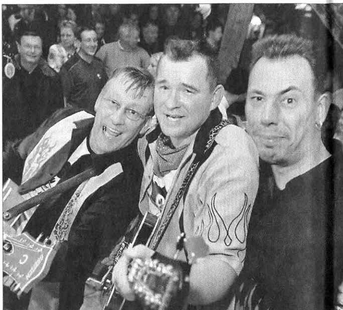
Im Mai 2008 musste die Band „Hepcazz“ aus ihrem Proberaum ausziehen. Das Trio hat bisher keine neue Unterkunft gefunden.

Für Musiker waren die vierstöckigen Lagerhallen sieben Jahre lang ein Paradies: massenhaft Platz, wenig Miete und kein Nachbar, der sich an aufgedrehten Verstärkern stört. 2008 der Schock: Vom Eigentümer, dem Bundesamt für Immobilienaufgaben, erhielten die Mieter die Kündigungen für die Übungsräume. Der Brandschutz sei nicht gewährleistet, hieß es.